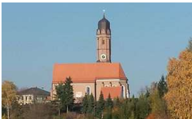
Pfarramt St. Andreas Pürkwang