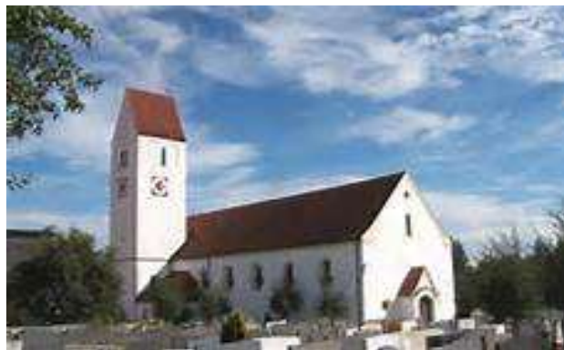
Pfarramt St. Elisabeth Kirchdorf